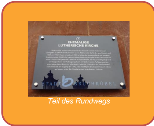
Teil des Rundwegs

➤ Seit Dezember ist der Text über die Historie unseres Hauses (ehemalige Lutherische Kirche) wieder lesbar. Im Rahmen der Neubeschilderung historischer Gebäude in der Kernstadt und dem damit verbundenen Rundweg wurde ein neues Schild montiert. Da unser Haus zentral gelegen ist, steht die Übersichtstafel des Rundwegs ebenso hier.