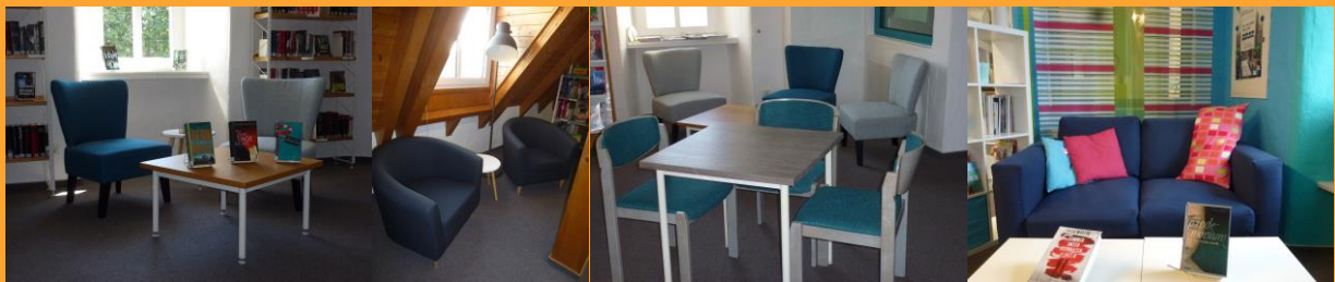
Neue Sessel – neu bezogene Stühle – Sofa in der Jugenddecke