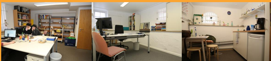
Altes Büro mit neuen Schreibtischen – neues Leitungsbüro – neue Teeküche