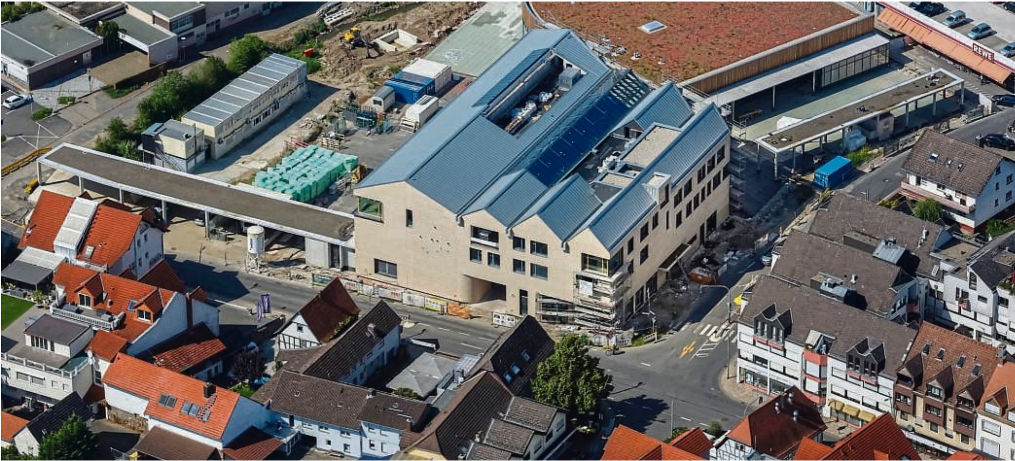
Das Gerüst ist abgebaut: Jetzt geht es um die Anschlüsse ans Kanalnetz sowie die Telekommunikationsleitungen. Dafür muss die Straße aufgerissen werden.