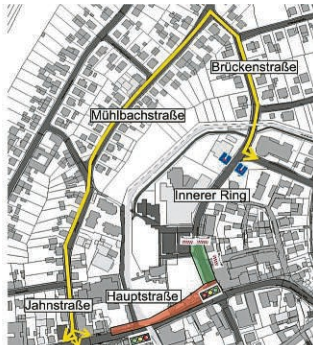
Autofahrer müssen jetzt einen Bogen fahren: Die Hauptstraße ist halb, der Innere Ring gar nicht befahrbar.

An den Arbeiten geht jedoch kein Weg vorbei, zumal der Rewe-Markt bereits vor Weihnachten eröffnet werden soll. In den kommenden Wochen soll die Tiefgarage an die Hauptstraße angebunden werden. Dazu ist es laut Mitteilung der Stadt notwendig, eine eigene Abbiegespur anzulegen, sodass es nach Inbetriebnahme der Parkfläche nicht zu Rückstau von einfahrenden Fahrzeugen kommt. Auch die Gehwege, Anschlüsse an die Kanalisation und sämtliche Telekommunikationsverbindungen müssten